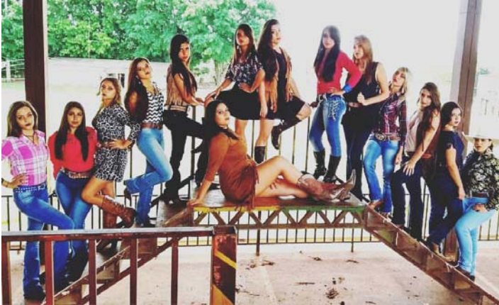
Catorze candidatas participam da escolha da Rainha e Princesas da 27ª Festa do Peão de Irapuru, são elas:

A festa da escolha da rainha e princesas acontece no próximo dia 21/04 (sexta-feira), às 20h, no Kaikan de Irapuru. Haverá baile com animação da banda Coyote Acústico. A entrada para o evento custa R$ 10,00 e pode ser adquirida com os organizadores da festa.